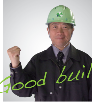
クリステル工業株式会社 代表取締役